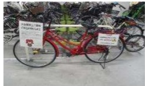
自転車盗難防止の取組 (アラーム)