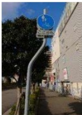
アマゴッタ付近 (自転車歩行者道)