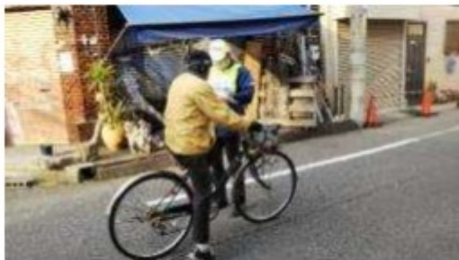
自転車事故防止の取組 (交通安全指導)

各分野の様々な取組については、本市の自転車のまちづくりに関する周知・広報などは全市的に取り組む一方、例えば、自転車事故や盗難の防止についてはそれぞれの多発エリアで、地域経済の活性化の事業は商業地域を中心にそれぞれ行うなど、地域ごとの特色を踏まえ、重点地区を設定し、効果的な展開を狙います。