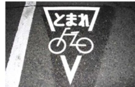
竹谷小学校区内交差点 (自転車とまれマーク)