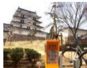
コミュニティサイクルポート (尼崎城)