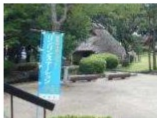
尼崎市リンリンステーション (市立田能資料館)