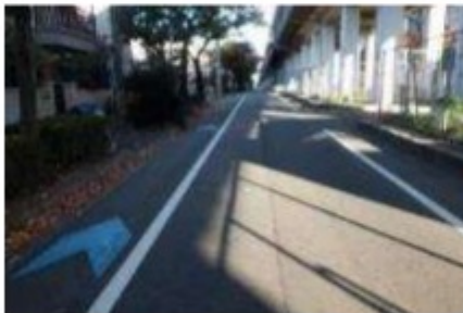
新幹線側道(矢羽根)