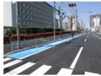
西川線(自転車レーン)