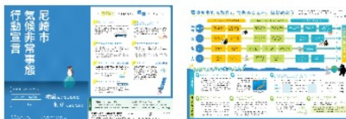
尼崎市気候非常事態行動宣言リーフレット