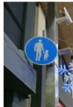
中央商店街 (歩行者専用道路)

正解は②です。こちらは歩行者専用道路のため自転車に乗ったまま通ることができません。このような場所では自転車から降り、押して通行しましょう。