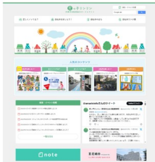
「尼っ子リンリン～尼崎市自転車総合ポータルサイト～」 トップページ