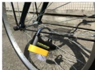
アラミーの南京錠型セキュリティロック